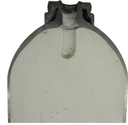
Schnitt einer C 2 H 2 -Flasche

Trotz des oben erwähnten Sicherheitssystems kann es unter ungünstigen Umständen zu einer Zerfallsreaktion im Flascheninnern kommen.